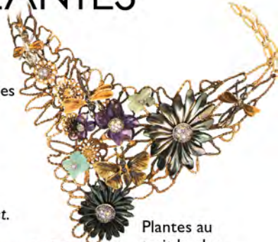
Plantes au trait le plus ornamental. / Ornamental plants with precise contrast outlines.